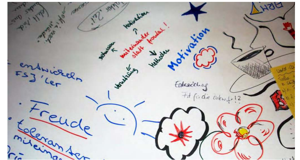
Papiertischdecke nach Abschluß eines World-Cafés